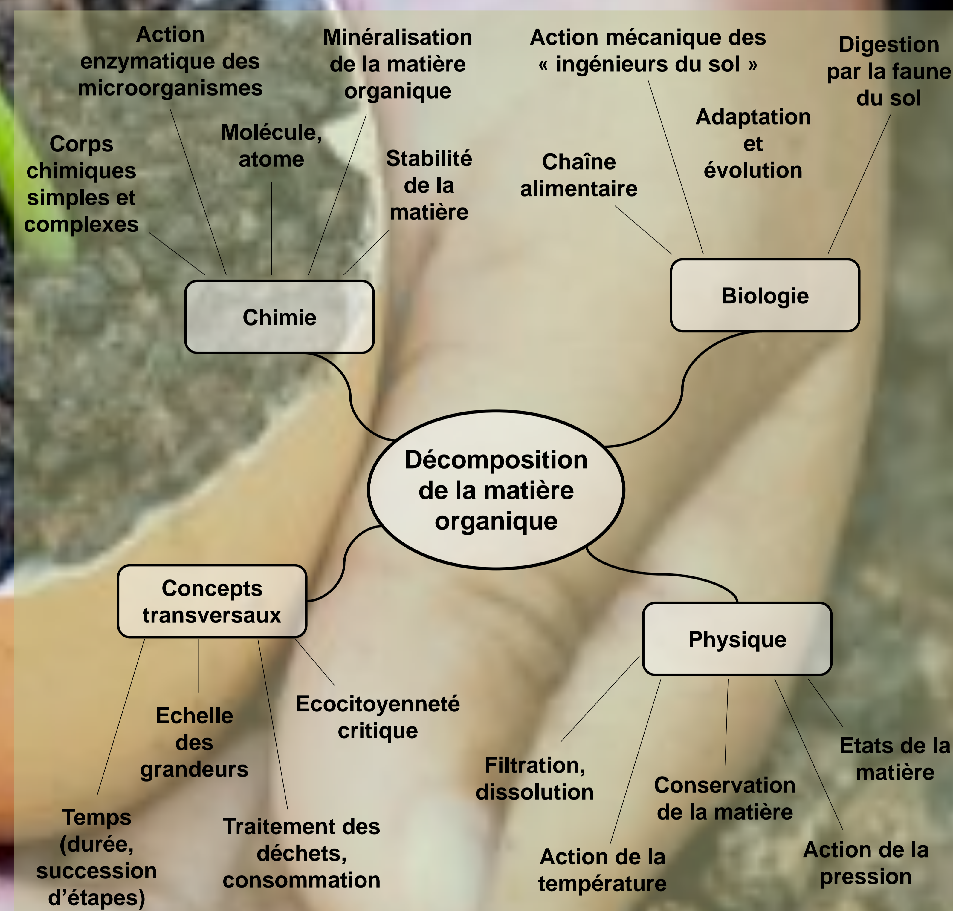
Figure 2: Concepts scientifiques impliqués dans la compréhension de la décomposition de la matière organique (V. Marchal)